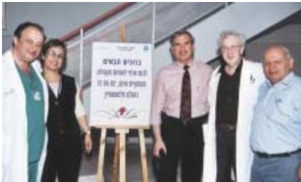
מימין: ד"ר ג'אבר לוטפי, פרופ' מרלוב, פרופ' מייזנר, ברכה גל ופרופ' פלדברג מ"מ מנהל מרכז לרפואת נשים

הכנס השנתי לאחיות הקהילה נערך ביוזמת הנהלת המרכז לרפואת נשים. בכנס הרצו פרופ' מוטי שוחט , מנהל המכון הגנטי על מומים מולדים בארץ ובעולם, פרופ' פאול מרלוב , מנהל מחלקת יילודים - על התפלגות המומים במהלך 25 השנים האחרונות, פרופ' ישראל מייזנר - על גישה חדשנית בטיפול המשכי בתקופה העוברית והנאו-נטלית ו ד"ר ברי קפלן - על הקשר בין ביה"ח והקהילה. בתום ההרצאות התקיים פאנל בהשתתפות צוות רב מקצועי בנושא התמודדות עם עובר ויילוד בעל מום.