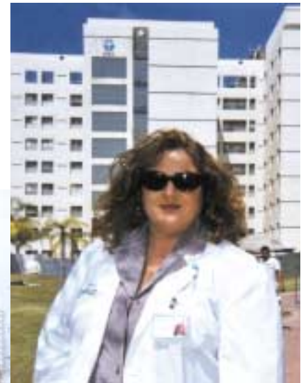
איים בתפקיד האחיות הראשית