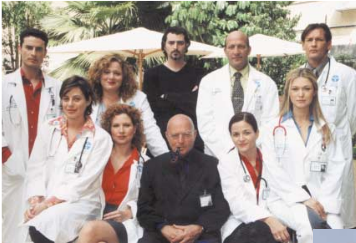
כוכבי הסדרה בקפטריה בגולדה-השרון