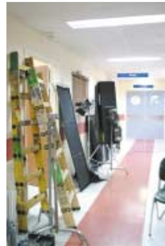
מכינים את סט הצילומים - מסדרון המחלקה הגריאטרית לשעבר בגולדה-השרון

בימים אלו מסתיימת הקרנת העונה הראשונה בערוץ 2 בטלוויזיה הישראלית (יום חמישי בערב) של סדרת הדרמה