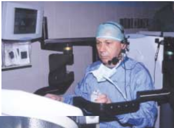
פרופ' כריסטיאנו הושר מפעיל את המערכת הרובוטית

סדרת ניתוחים באמצעות מערכת הרובוט החדשנית "זאוס", הקיימת בישראל רק במרכז רפואי רבין, התבצעה לאחרונה. כזכור, לפני כחצי שנה התבצע באמצעות מערכת זו, לראשונה בישראל, ניתוח מעקפים ומאז ביצע הרובוט בבית החולים 20 ניתוחי לב שונים. במסגרת הסידרה הנוכחית, התבצעו ניתוחי כיס מרה וניתוח למניעת רפלקס (פגודופליקציה) שהועברו בשידור חי מחדר הניתוח אל אולם הכנסים במרכז פלסנשטיין למחקר רפואי, בהם צפו כירורגים מכל הארץ. הניתוחים בוצעו ע"י מנתח אורח בעל שם עולמי, פרופ' כריסטיאנו הושר מאיטליה, ד"ר משה רובין ממחלקת כירורגית ב' בבילינסון ו ד"ר אלדד פובזנר