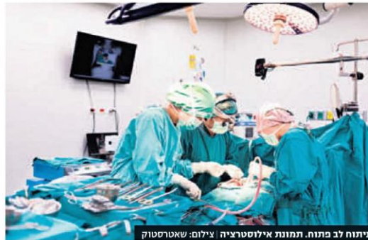
ניתוח לב פתוח. תמונת אילוסטריה

ממשיכים לזנות את הרוב הגדול של חולי הלב. הנתונים המפתיעים מוכיחים את הפער הניכר: 79% גברים לעומת 21% נשים בלבד סובלים מאירועי לב. הגיל הממוצע לאירוע לב בקרב גברים הוא 64 ובקרב נשים 74. אחת הסיבות לכך שאירועי לב מתרחשים בגיל מאוחר יותר אצל נשים הינה בשל שינויים הורמונליים החלים אצלן בגיל המעבר. התסמינים השכיחים לאירועי לב אצל גברים הם תעוקת חזה ולחץ במרכז החזה, הקטנת הכאב לידים, לצוואר, בחילות והקאות. אצל נשים התסמינים כלליים יותר ופחות מובהקים בהש