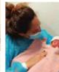
הפגישת התינוקת עם הוריה בבית החולים מאו