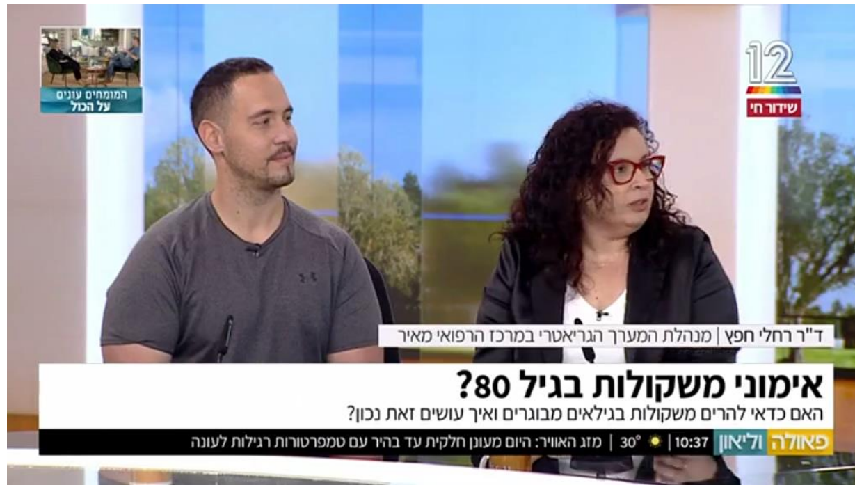
המומחים עונים על הכול

הקורונה מתפשטת • עלייה בנתוני התחלואה: 7,000 מאומתים חדשים, 300 מאושפזים