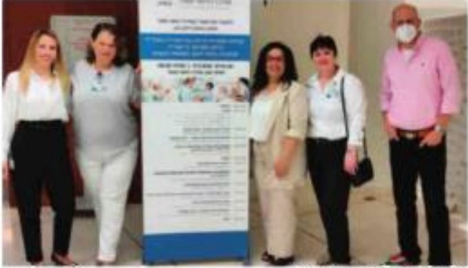
בס המערך הגריאטרי

היעוץ הגריאטרי הניתן על ידי אחות ממוחזרת קלינית בגריאטריה, הינו פורץ דרך ומספק רפואה פראקטיבית (יזומת), שמזהה את הצורך של המטופל ומנגישה את רצף הטיפול הרב מקצועי לו הוא זקוק בקהילה