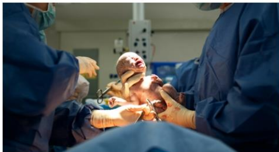
ניתוח קיסרי (אילוסטרציה)

כל הנשים סבלו לפני ההליך מאי פוריות מוחלטת - הן נולדו ללא רחם או נאלצו לעבור כריתה שלו בשל מחלות שונות. את העבודה המדעית בנושא הזה ריכזה ד"ר ליוה יוהנסון מהמרכז הרפואי של אוניברסיטת ביילור בדאלאס. ההליך נמצא בטוח לנתרמת, לתורמת (בחיים) ולתינוק. ההערכה: יותר ממיליון נשים אמריקאיות עשויות להפיק תועלת מהשתלת רחם.