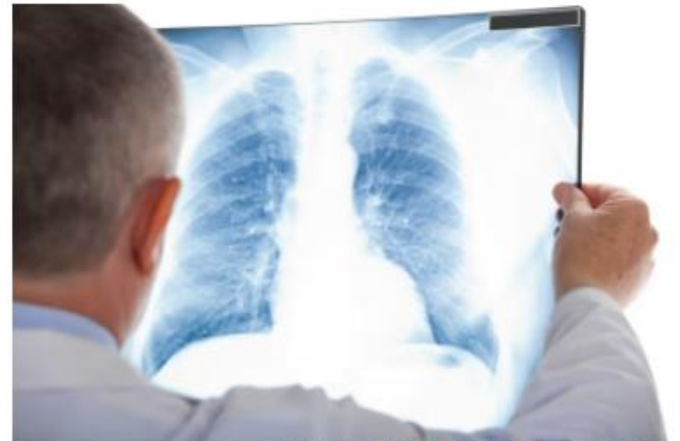
מיפוי הגנום האנושי סימן אבן דרך משמעותית בהבנת מחלות, בהן סרטן