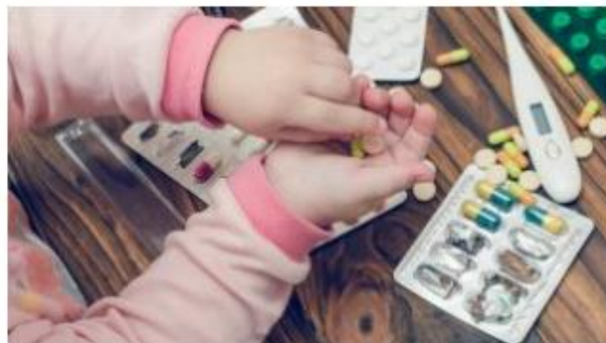
הרעלות בקרב ילדים, צילום: אילוסטרציה

עם העלייה בשימוש בתרופות המיועדות לטיפול בבעיות קשב וריכוז בילדים ובבני נוער, נרשמה גם עלייה בכמות ההרעלות שנובעת ממניון יתר של תרופות אלו, בטעות או במכוון. כך עולה מנתונים שנאספו על ידי המרכז הארצי להרעלות ברמב"ם. כך דיווח אדיר ינקו ב-ynet.