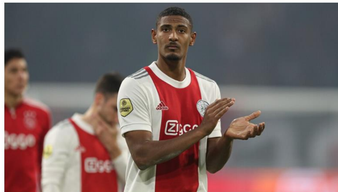
החלים "f*** CANCER" הודפסו בסוף