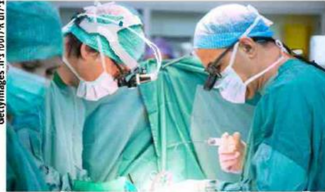
אנחנו רואים סיבוכים קשים אצל המנותחים בטורקיה

"היא הוכנסה באופן מיידי לחדר הניתוח, שם עברה ניתוח ראשוני לייצב את מצבה, והועברה להמשך טיפול ביחידת טיפול נמרץ כללי. יממה לאחר מכן, בשמחה,