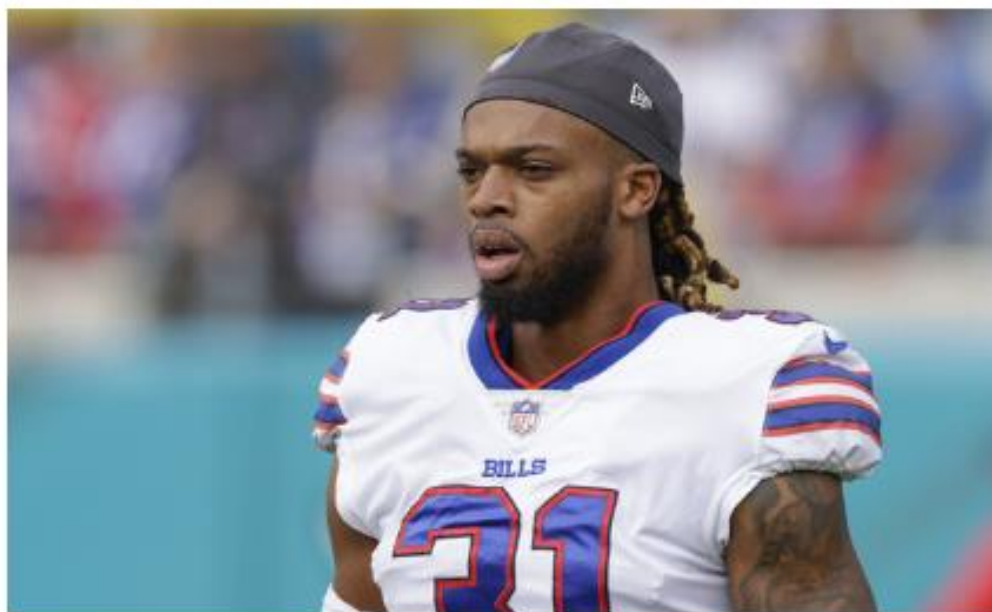
דמאר המלין