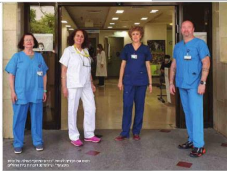
הננו עם הברית לענות. "נורס סינרף מעולה של צוות מקצועי"