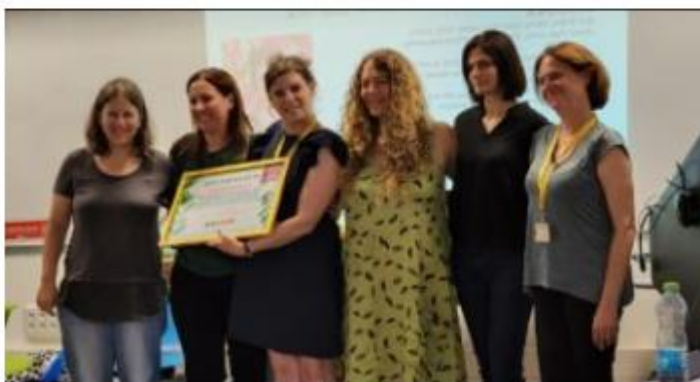
סיום קורס בסמינר הקיבוצים לבניית מרחבים היברידיים עבור הילדים המאושפזים.

לטובת הילדים המאושפזים: נחנכה 'המרפסת' במרכז הרפואי מאיר