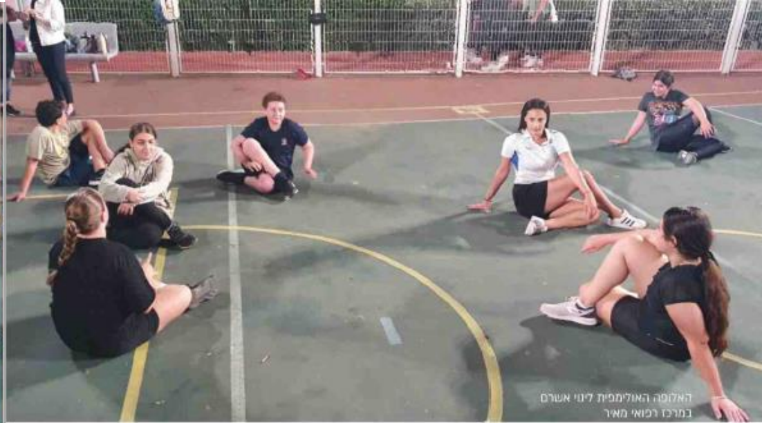
האלופה האולימפית לינו אשרם במרכז רפואי מאיר