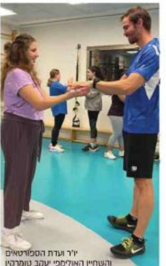
י"ר ועדת הספורטאים והשחיין האולימפי יעקב טומרקין