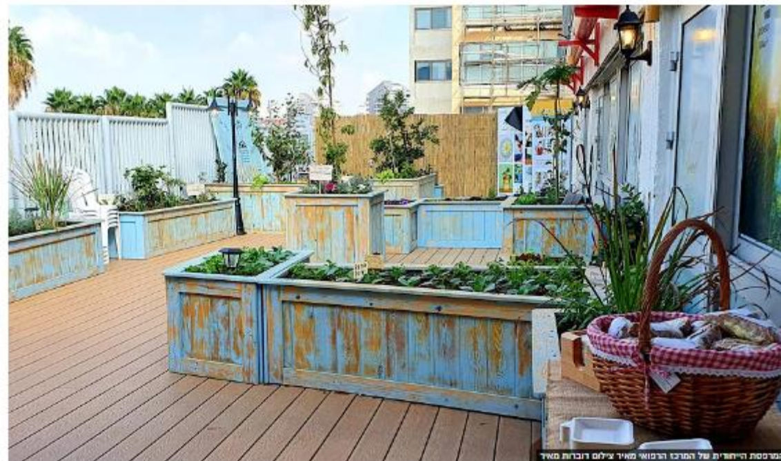
המרפסת הייחודית של המרכז הרפואי מאיר