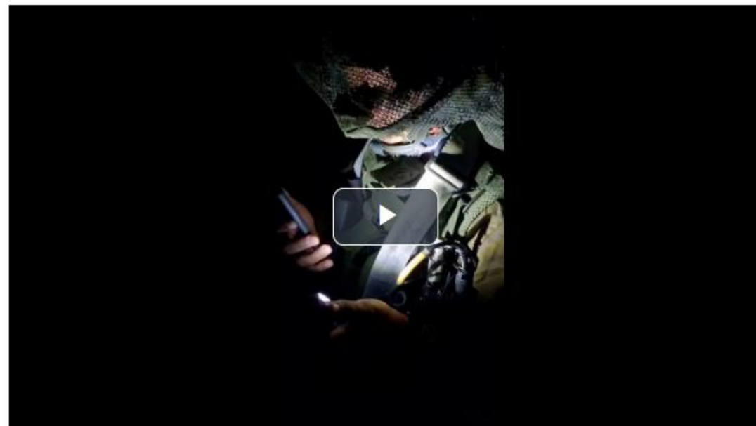
החיים חזקים מהכל - לוחם בחזית צופה בלידת בנו

14:17, 16/10/2023, עודכן 14:17, 16/10/2023