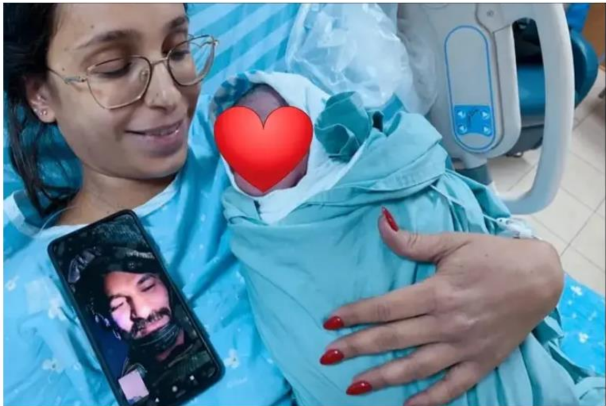
"המיילדות לא הסכימו לוותר על הנוכחות של בעלי ברגעים האלו". שירה עם הבן שנולד והאב שצפה בלידה בטלפון מחזית הלחימה בדרום

בלידה מרגשת מאוד, שלא השאירה עין אחת יבשה בחדר הלידה ומחוצה לו, נולד בנם הרביעי של בני הזוג במשקל תקין של 3.785 ק"ג, כשהאב זכה לראות אותו בשידור חי דרך הטלפון שלו ברגעים הראשונים, מיד כשיצא לאוויר העולם ועדיין המשיך להגן על הבית של כולנו.