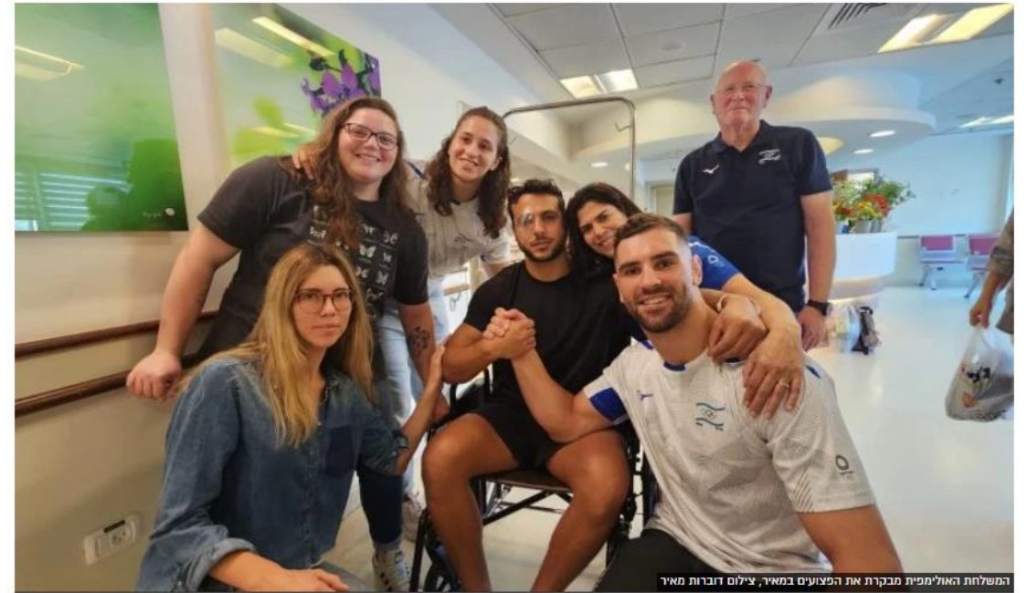
המשלחת האולימפית מבקרת את הפצועים במאיר

משלחת של ספורטאים אולימפיים מישראל ונציגי הוועד האולימפי בישראל, הגיעה לבקר בשבוע שעבר פצועים מהעוטף המאושפזים במרכז רפואי מאיר ולחזק את רוחם. חברי המשלחת עברו מיטה מיטה והקשיבו לסיפורי הגבורה והכאב של הפצועים ובני משפחותיהם. לא ניתן היה לעצור את הדמעות במפגש במרכז הרפואי מאיר עם פצועי העוטף, אזרחים וחיילים.