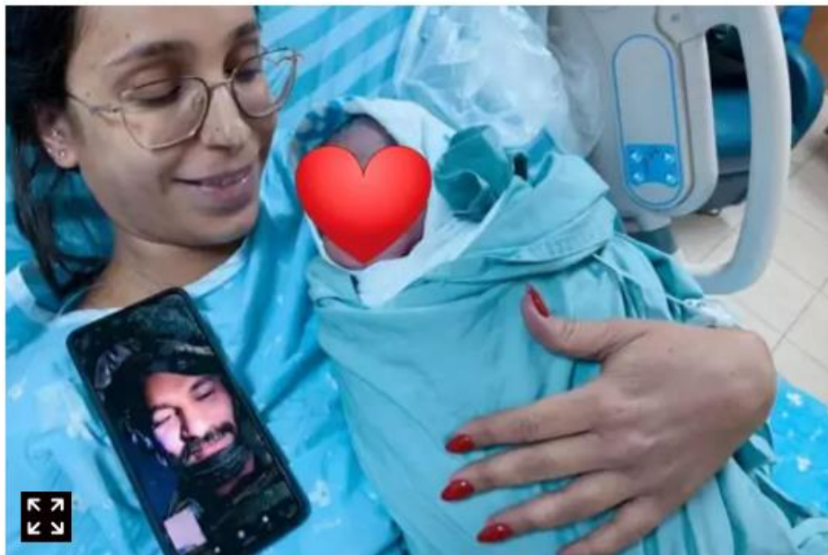
יולדת מראה ללוחם בחזית את לידת בנם בשידור בסלולאר

אתמול (ראשון) לפנות בוקר הגיעה שירה למרכז רפואי "מאיר" בכפר סבא ללדת את ילדה הרביעי. גם היא לא תיארה לעצמה שבמקום להיות לצדה, בעלה יהיה בשיחת וידאו - רחוק פיזית אבל, הכי קרוב שיש ללב.