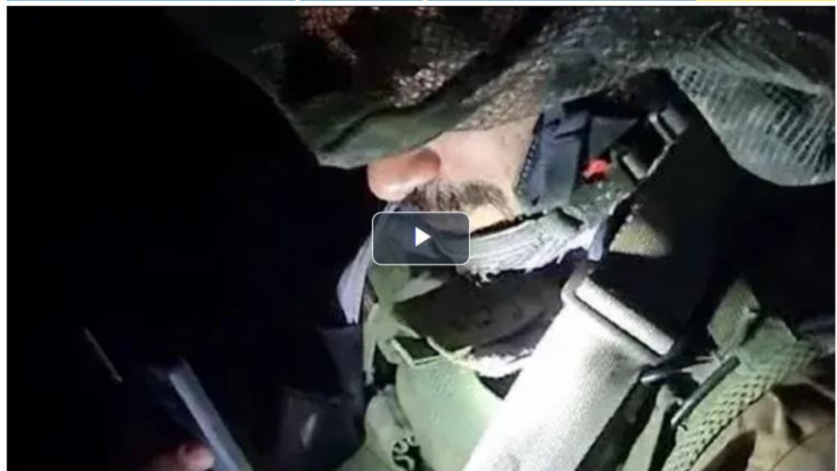
הבעל, שנלחם בדרום, צפה בלידת בנו בשידור וידאו חי בטלפון