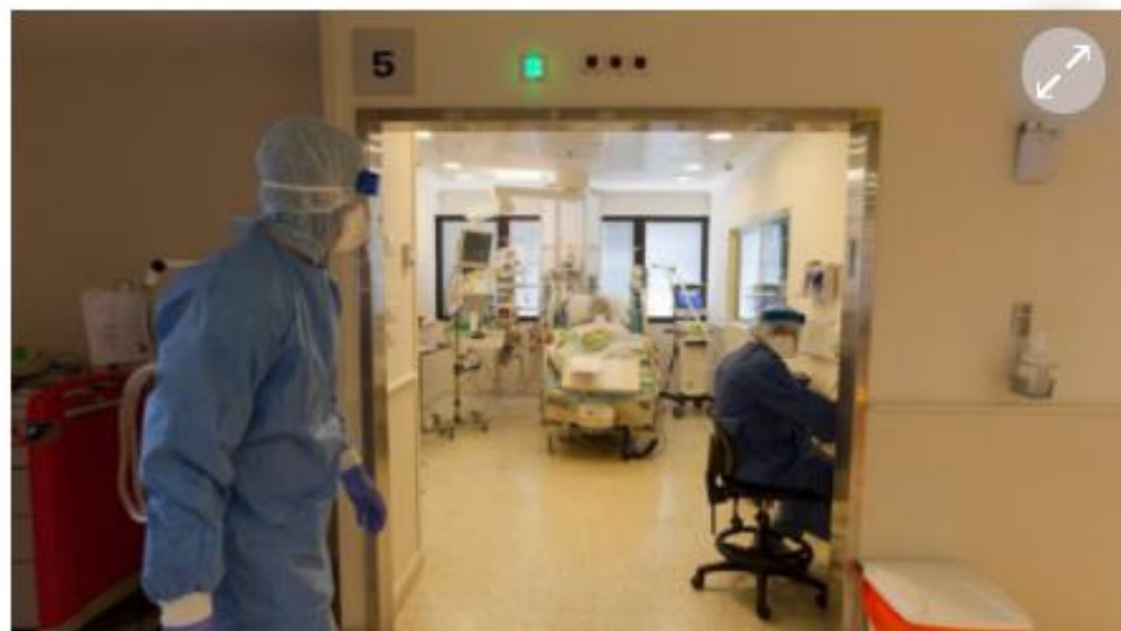
מחלקת הקורונה בבית חולים מאיר