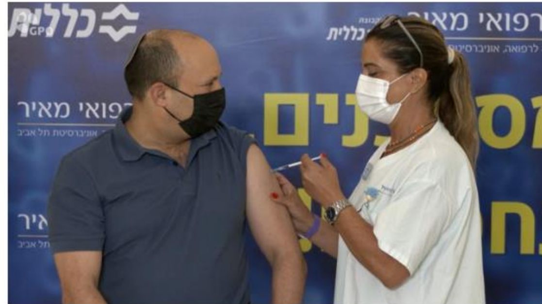
בנט קיבל בוסטר: "אם תצאו להתחסן - נוכל להימנע מסגר רביעי"

ביום הראשון לחיסון בני 40 ומעלה קיבלו יותר מ-56 אלף ישראלים את מנת החיסון השלישית. יחד איתם, כ-4,000 איש הגיעו לקבל את המנה הראשונה.