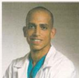
רד נב מרום

קרי של הרצועה הצולבת הקדמית בברך (ACL) היא פציעה שכיחה בקרב כדורגלנים מקצוענים המצריכה הירידות מסוימת מפעילות האתלטים בעלת השלכת פריחה, טכנולוגיה וכלכלית משטר עיוות. למרות ההבנה הולכת וגוברת של פציעת אלה וירידתם של תוכניות מניעה שונות, שכיחות פציעה זו אינה יורדת באופן מסמיק. מחקרים מראים שכדורגלנים מקצוענים יחזרו ברוב מוחלט של המקרים לכדורגל מקצועני לאחר טיפול מרוב (ניתוח) ושיקום, אולם לא כולם חוזרים לאותה רמת שחקן נתון ממידת עדי יחיד. הוא העובדה שהליקם צמיח לרבות פציעות רצועה צולבת קדמית נוספת. משאבים אחרים של מחקר מנסקים ביום בדי לברך טוב יותר את הפציעות הללו בקרב ספורטאים מקצוענים בענפים בהם מניעה זו שכיחה, במסגרת להחזיר את שכיחותה באמצעות תוכנית מניעה חריגה. אולם מחקרים, בנוסף, במסגרת לייב את הרובי המופלג השיקום לכשפציעה כזו מתרחשת. מחקר שפורסם ברבעון בבריטיש הבריטי האורתופדי בקיץ שי המאפיינים של פציעת אלה בכדורגלנים מקצוענים היה המחקר של Della Villa ועמיתיה שפורסם בכתב העת הבריטי ההיסטרי בעולם כרפואת ספורט The British Journal of Sports Medicine. במחקר זה ברצו ניתוח של כל פרטני הירא של משחק הכדורגל בליגת הכדורגל האיטלקית הראשונה והשנייה במהלך 10 עונות. החוקרים איתרו תרחיש שגבת של פציעת של הרצועה הצולבת הקדמית (ACL) תוך הצלחה עם טכניקה מידע התפרסם פציעות אלה הירא הענפים עם הצלחה המספקי במסגרת הכדורגל השנייה 154 פציעות אחרת.