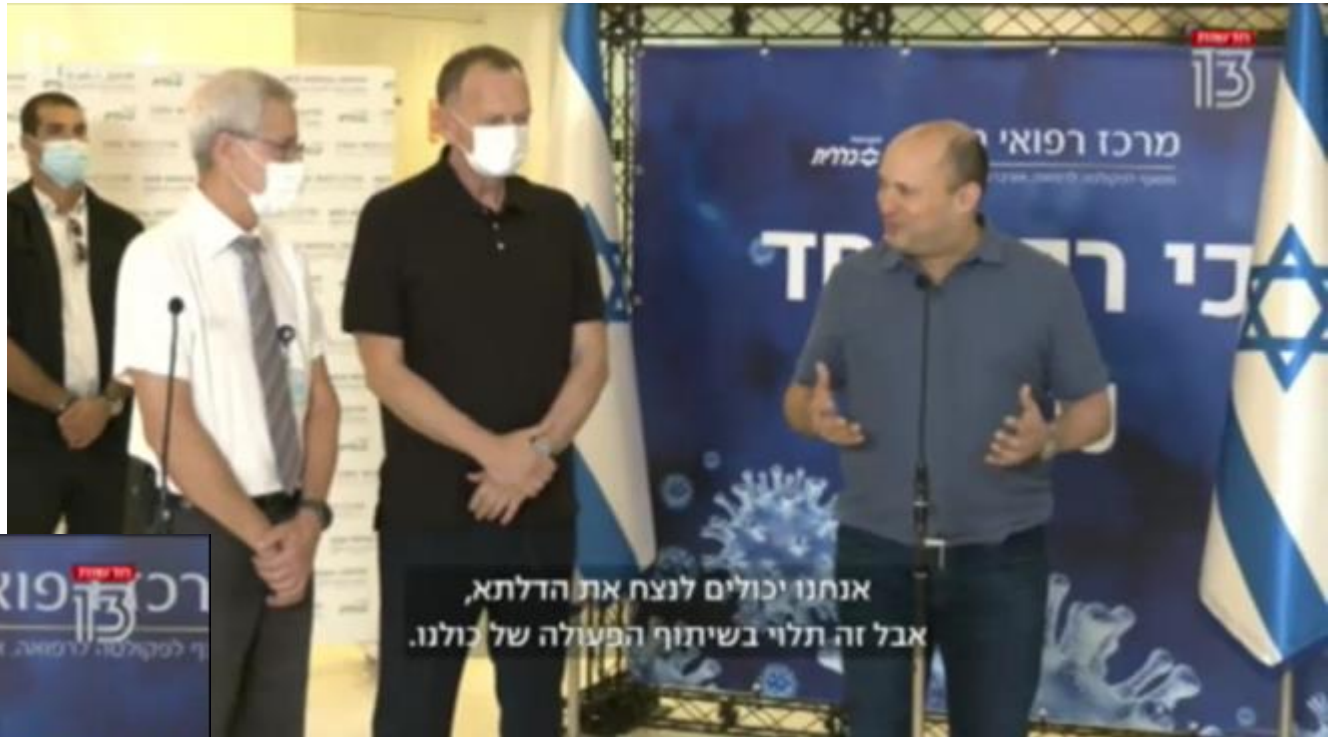
אנחנו יכולים לנצח את הדלתא, אבל זה תלוי בשיתוף הפעולה של כולנו.