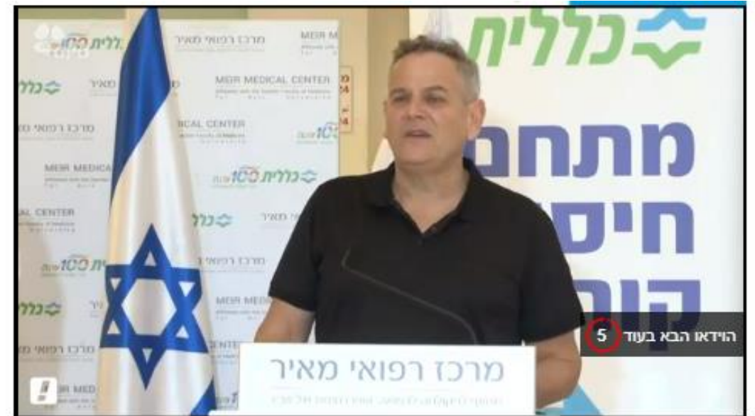
ניצן הורוביץ מתחסן (עריכה: אביעד בללי)

הורוביץ פנה לצוותים הרפואיים והדגיש: "אני יודע שבמשך הרבה שנים הרעיבו את המערכת הבריאות, אני רוצה לשנות את זה. אנחנו ניתן את התקנים ואת התקציבים". בהמשך, הוא התייחס גם לפתיחת שנת הלימודים ב-1 בספטמבר. "חשוב שהמערכת החינוך הכללית תיפתח ב-1 בספטמבר. בפתחת שנת הלימודים נחסן גם בבתי הספר. ננצל כל פלטפורמה כדי לחסן. נגיע לכל מקום ונחסן את כל מי שצריך", אמר הורוביץ, שהדגיש כי סגר הוא בגדר "מוצא אחרון והוא לא פתרון מוצלח. הוא מצב של אין ברירה ואנחנו לא רוצים להגיע לשם. אנחנו עושים את כל הצעדים כדי לא להגיע לשם".