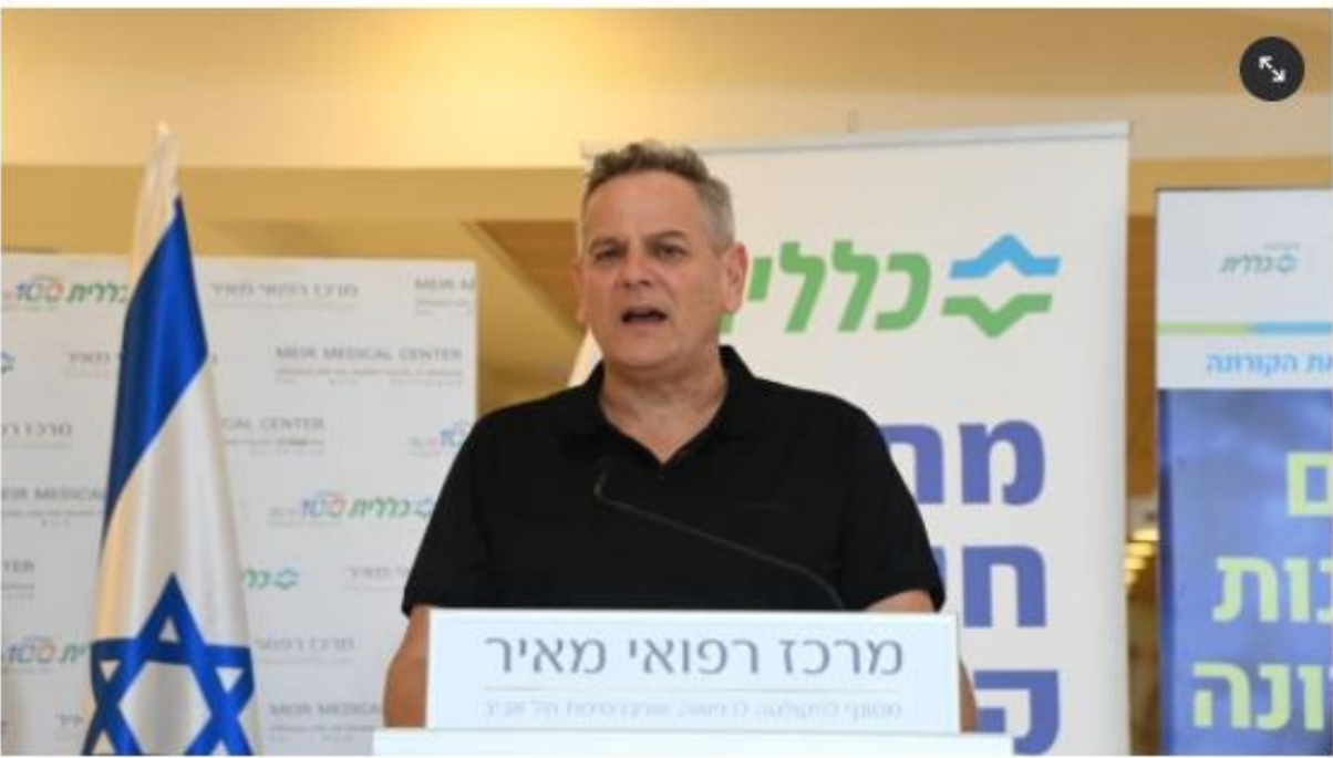
סרג' "זה פתרון לא מוצלח, עושים הכול כדי להימנע ממנו"