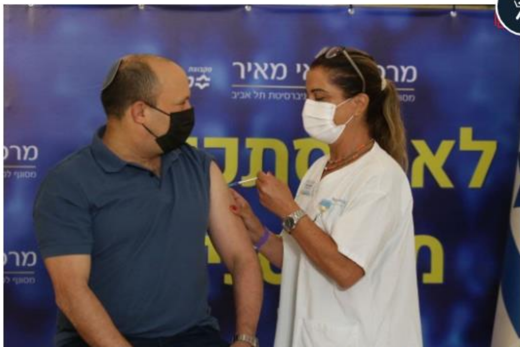
ראש הממשלה נפתלי בנט מקבל חיסון שלישי ל קורונה