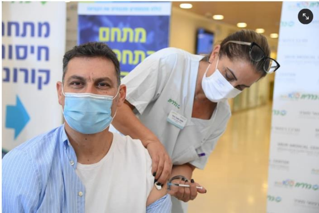
70 אחוז ציינו שהם חשו פחות תופעות לוואי לעומת מנת החיסון השנייה. החיסון השלישי

"הציבור לא בקיא בזה אבל יש אנשים שעושים אי ספיקת כבד גם לאקמול. כל מה שאנחנו מכניסים לגוף שלנו, ממזון ועד תרופה וחיסון, יש איזשהו פרומיל אחוז שיכול לעשות איזושהי תופעה. מדובר בחיסון ובמחלה עם יחסי ציבור גבוהים. אנחנו כל הזמן חוקרים אותה, יותר אולי מכל מחלה בעשורים האחרונים, ואנחנו עדיין מדברים על מספרים מאוד-מאוד קטנים.