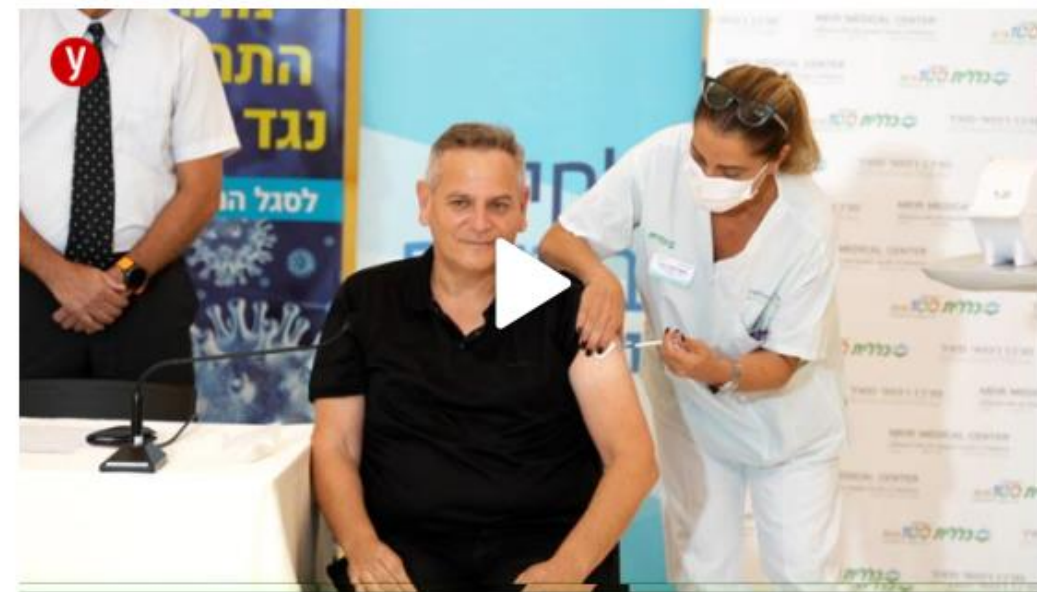
השר הורוביץ התחסן: "שעה גורלית"