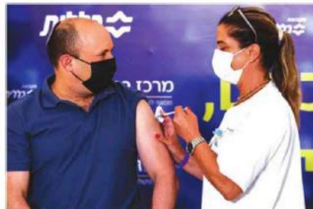
PRIME MINISTER Naftali Bennett receives a third shot of the COVID-19 vaccine in Kfar Saba on Friday.

Last week, Education Minister Yifat Shasha-Biton said she held professional meetings with parents' representatives, teachers, principals and heads of local authorities to prepare