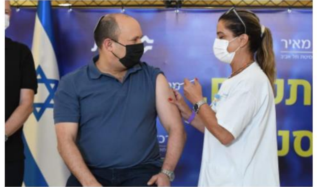
"זה בהישג יד, אבל אנחנו עוד לא שם", בנט מתחסן במנה השלישית, היום

ראש הממשלה נפתלי בנט בן ה-49 הגיע הבוקר לבית חולים מאיר בכפר סבא כדי להתחסן במנה השלישית נגד נגיף הקורונה, לאחר שאמש משרד הבריאות המליץ לבני 40 ומעלה לקבל את מנת הבוסטר. "אם תצאו להתחסן בחיסון השלישי - נוכל למנוע את הסגר הרביעי", בנט מסר במעמד החיסון.