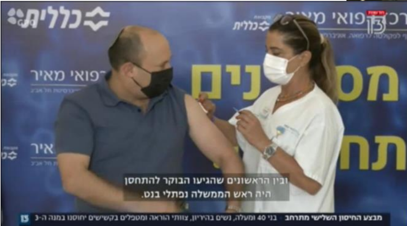
ובין הראשונים שהגיעו הבוקר להתחסן היה ראש הממשלה נפתלי בנט.