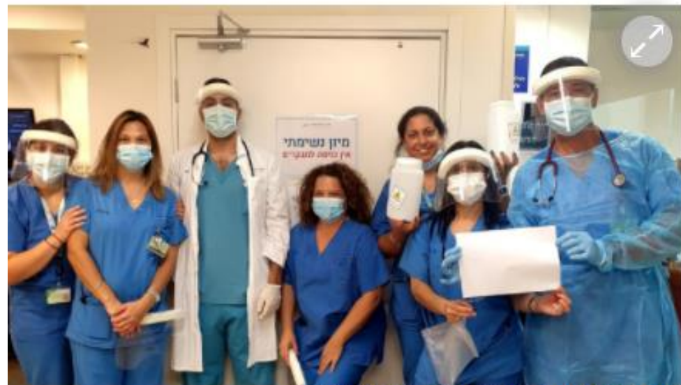
בית חולים מאיר מסכם שנה

לצד אתגרי הקורונה, זכה השנה מרכז רפואי מאיר מקבוצת כללית בהישגים מרשימים, לרבות בציון מושלם של 10 במדדי איכות של משרד הבריאות לשנת 2020, ופיתח שירותים חדשים ופורצי דרך לטובת המטופלים, פעולות והישגים המעידים שוב על היותו מרכז רפואי מצטיין בארץ.