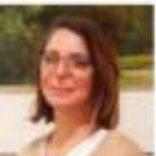
לבנה המנוח: "יו טלמון"

גורן רד', אחות אחראית: "יש עומס מהפורץ על הבידוק אחריו לא נשמת, אבל לא מתלוננת. אחרת מרגישה כשיצומו עלי קרב שמתנת חייבות לצנח בן, זה לא קל בכלל"