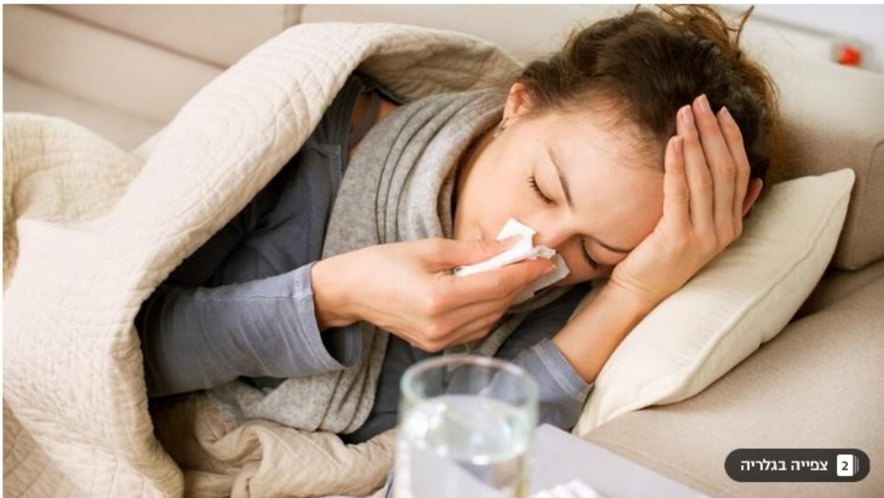
2 צפייה בגלריה

גם הנגיף שגורם למחלת השפעת יכול ליצור מחלה ממש קשה