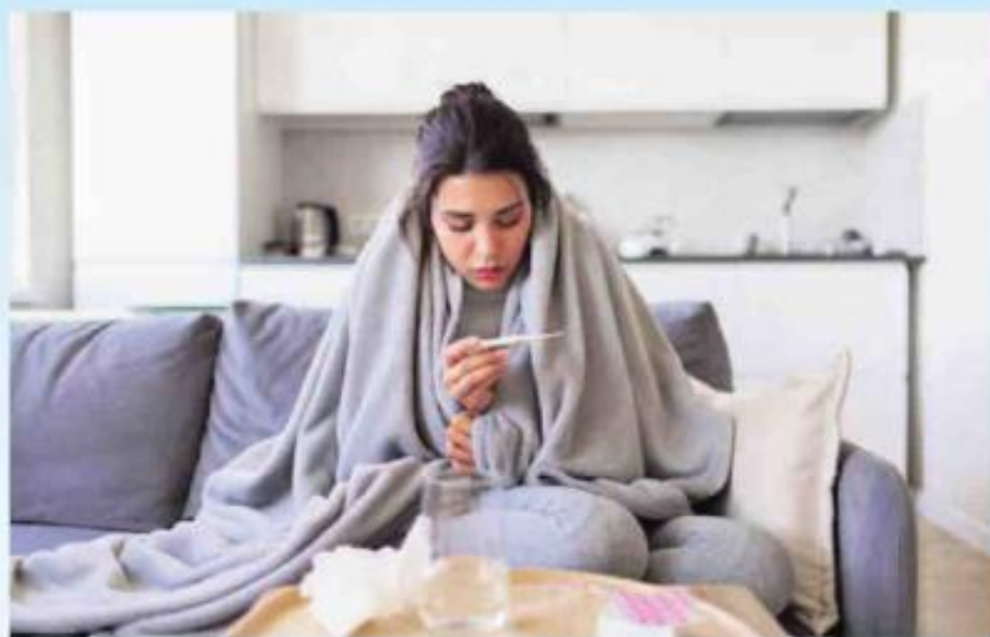
ילדות: © iStockphoto.com/קריסטין

כולם מדברים על קורונה, אבל בחורף הזה יש עוד סכנה