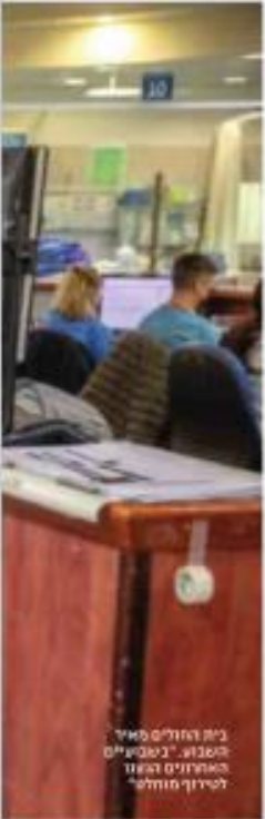
בית החולים מאיר