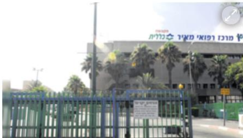
בית חולים מאיר

שנת תשפ"א הייתה שנה מיוחדת למומחי הספורט של מרכז רפואי מאיר, המלווה רפואית מעל 20 שנה את הסגל האולימפי. במשחקים האולימפיים אשר התקיימו השנה בטוקיו ליווה צוות מקצועי ממאיר את הספורטאים האולימפיים, שניים מהרופאים, פרופ' דני נמט וד"ר ערן דולב נסעו עם המשלחת האולימפית שחזרה עם הישגים מרגשים ביותר. בנוסף, במרכז ספורט ובריאות לילדים ונוער, המוביל בטיפול ובמחקר בנושא בריאות בילדים ובני נוער, טופלו השנה 241 ילדים ובני נוער.