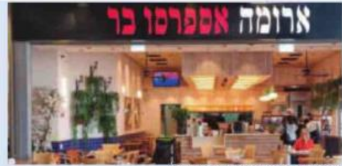
בית קפה ארומה ב"רננים"