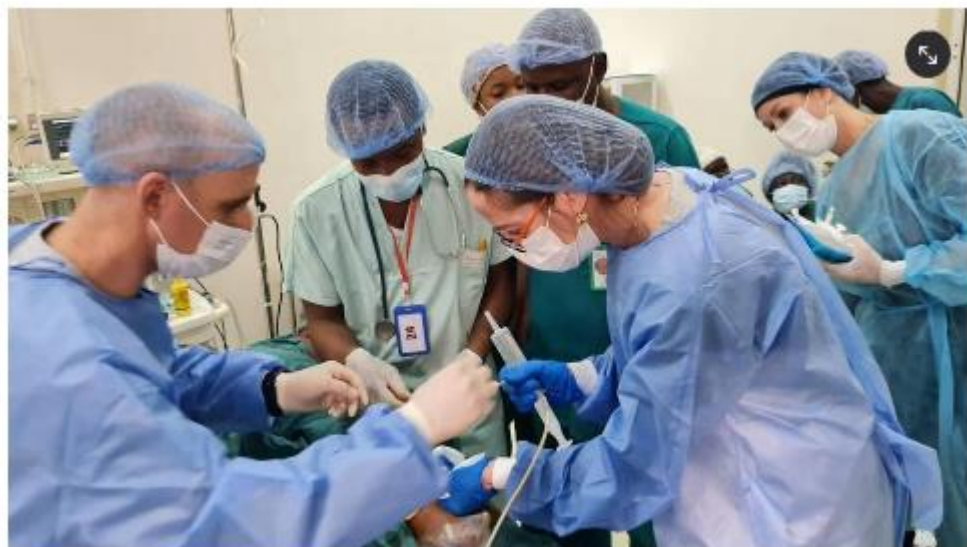
מטפלים בילדים של צ'אד