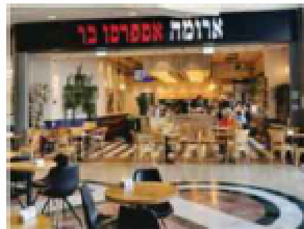
סניף "ארומה" ברננים

בהכנת הידיעה השתתפו מיטל יסעור בית'אור והיאלי יעקביהנדלסמן