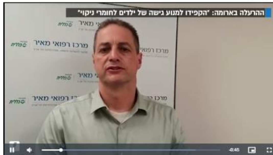
בוידאו: בעקבות ההרעלה בארומה סגן מנהל בית החולים מאיר מדגיש שיש למנוע גישה של ילדים לחומרי ניקוי רעילים

גבר כבן 50 הובהל היום (שני) לבית החולים מאיר בכפר סבא כשהוא מורדם ומונשם, לאחר ששתה תה שהכיל מסיר שומנים בסניף "ארומה" בקניון רננים ברעננה. הגבר, תושב כפר סבא, פונה לאחר שחש צריבה בפה ושפתיו התנפחו. במשטרה חוקרים חשד לרשלנות מצד עובדי הסניף.