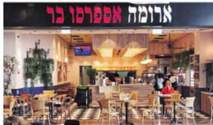
סניף ארומה ברעננה שבו הוגש התה עם מסיר השומנים

גבר ששתה תה ג'ינג'ר בסניף "ארומה" ברעננה, הובהל לבית החולים מאיר במצב קשה • הרופאים במיון גילו: בכוס היה מסיר שומנים, שגרם לחסימת נתיב האוויר שלו • עובד הסניף נחקר באזהרה • "ארומה" בתגובה: "בוחנים את המקרה במלוא החומרה"