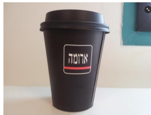
סכנת חיים ככל הנראה חמרי החשוד כממיס שומנים

הגבר הגיע עם כוס השתייה למיון ונמסר לצוות כי ישנו חשד שהיה בכוס ממיס שומנים. בבדיקת מעבדה שנערכה בבית החולים, אכן התגלה שמדובר בחומר בסיס חזק המאפיין ממיסי שומן.