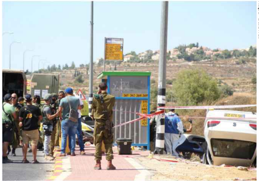
זירת הפגיעה, אוגוסט 2019. מעוצמת המכה רכבו של המחבל התהפך