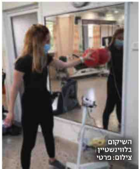
השיקום בלוינשטיין

יעלה דנציגר השבוע. "לא משנה כמה זמן זה ייקח, אחזיר את היד לתפקוד מלא"