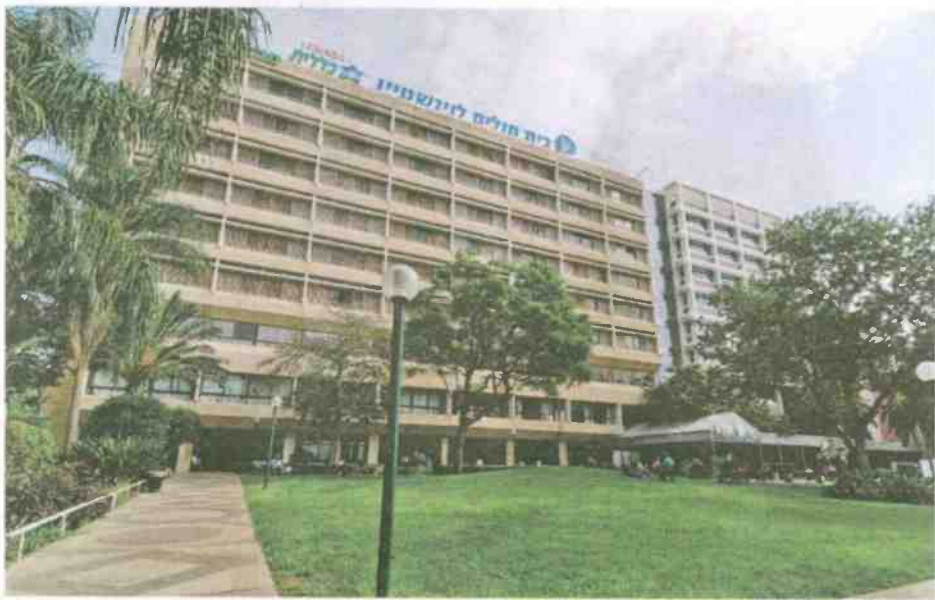
המרכז הרפואי לשיקום לוינשטיין