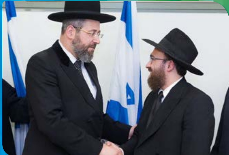
עם הרב הראשי לישראל הגאון הרב דוד לאו שליט"א