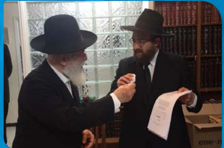
עם הגאון הרב יצחק זילברשטיין שליט"א במכירת חמץ של חברות התרופות