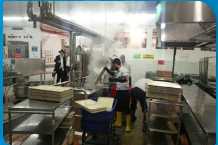
ההכשרות לפסח במרכז רפואי העמק בעפולה