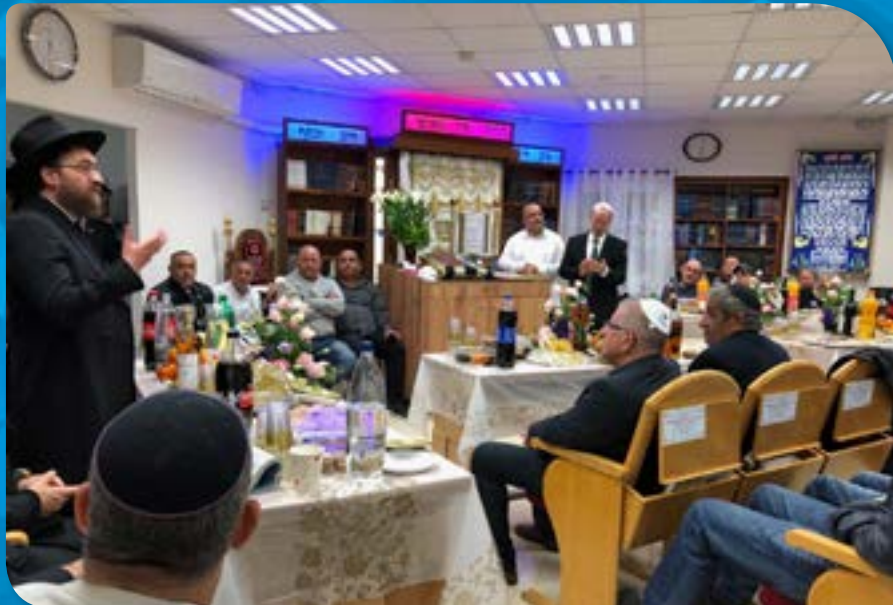
במעמד פתיחת בית הכנסת המשופץ במרכז הרפואי 'יוספטלי' באילת