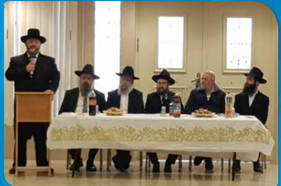
בבית הכנסת במרכז הרפואי 'סורקה' בכאר שבע עם רב העיר הרב הגאון יהודה דרעי שליט"א