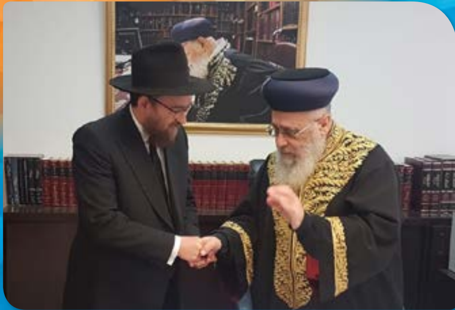
בפגישה עם הרב הראשי לישראל הראשון לציון הגאון הרב יצחק יוסף שליט"א