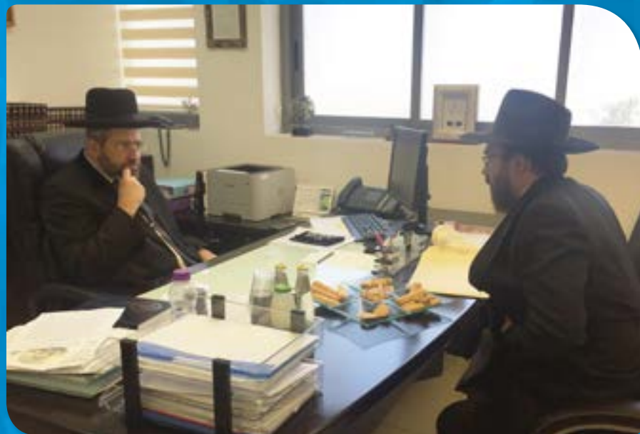
בדיון הלכתי בנושאים שעל סדר היום הציבורי עם הרב הראשי לישראל הגאון הרב דוד לאו שליט"א