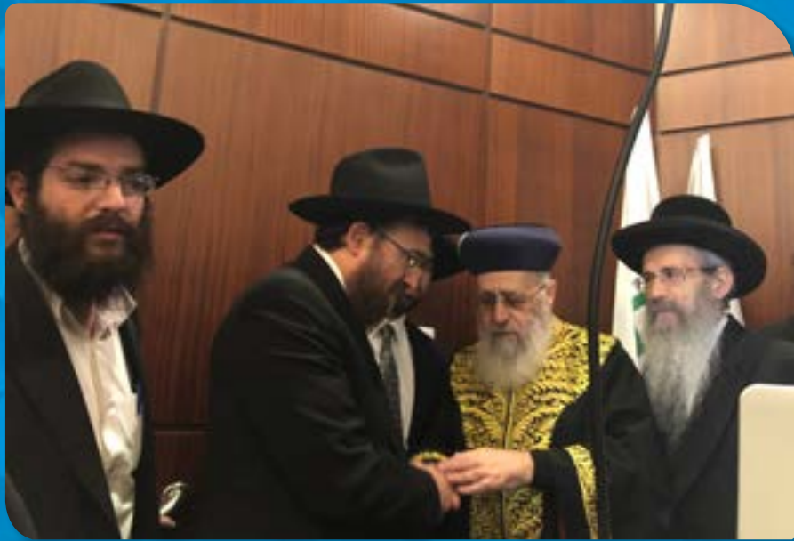
בביקור הרב הראשי לישראל הראשון לציון הגאון הרב יצחק יוסף במרכז הרפואי 'העמק' עם רב שירותי בריאות 'כללית' הרב מנחם לפקיבקר, הרב ישעיהו הרצל - רב העיר נצרת עלית והרב יוסף יצחק סגל - רב מרכז הרפואי העמק