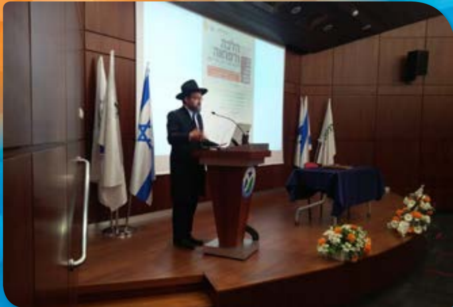
כנס 'ירפואה והלכה' במרכז הרפואי העמק שאורגן ע"י מחלקת דת וכשרות עבור מוצי"ם ופוסקי הלכה מכל רחבי הארץ