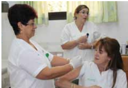
צוות מרכז הבריאות במעלות במעלות מראשוני המתחסנים בשנת 2011

תחלואת השפעת גורמת להופעת סיבוכים רבים, בילדים בעיקר דלקת ריאות ודלקות אוזניים שמחייבות נטילת אנטיביוטיקה, על כל הסיבוכים הכרוכים בכך. כמוכן שהסיכון ורמת הסיבוכים עולה בקרב הסובלים מאסטמה או ממחלות כרוניות אחרות. במקרים רבים מסתיימת המחלה הקלה, לכאורה, באישפוז ולדאבוננו גם מקרי המוות אינם מבוטלים.