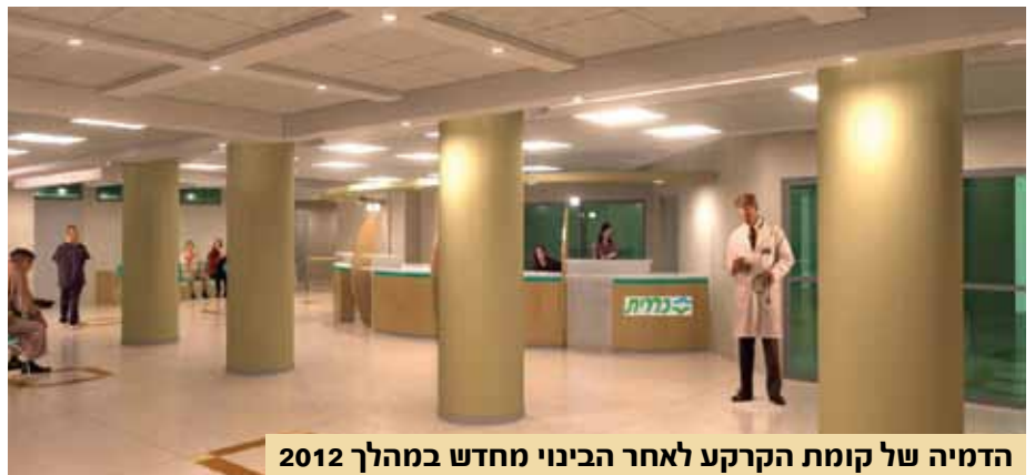
הדמיה של קומת הקרקע לאחר הבינוי מחדש במהלך 2012

מותאם לצרכי הלקוחות ולרפואה המודרנית. מחלקת התאונות תפעל במתקן חדיש ובצדה תפעל גם מחלקה חדשה לאבחון פנימי דחוף עם 11 מטות השהיה, כך שהאתר ישמש מעין "חדר מיון" למצבים שאינם מחייבים הפניה לחדר מיון בבית חולים.