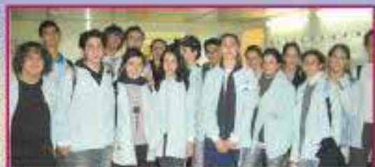
תלמידי בית הספר הריאלי הסתגלים במחלקת הילדים

המוכרת, עלולה להיפגע יכולתם ללמוד. הוא במחלתם", הוא אומר. "הניתוק מקבוצת השיחות הטבעית שלהם, חבויים לכיתה ולבית הספר, מתן את אותותיו גם