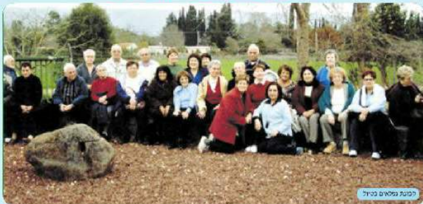
קבוצת גמלאים בטויל

בלבד. סופסי הרשמה ניתן לקבל בוועד הגמלאים. אנו, חברי הוועד, מברכים את עמיתינו הגמלאים, ומצמים לראותכם בכל הפעילויות שנארגן.