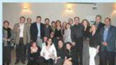
יחידת טיפול נמרץ לכ כסימין