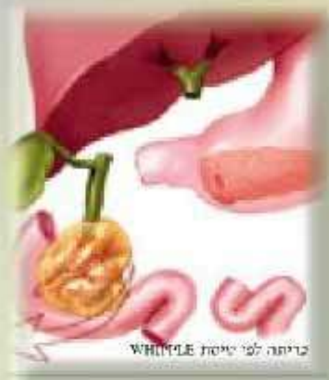
כריתה לבי טיטת Whipple

ניתוחי, בגלל שבמרבית המקרים מטלה המחלה בשלב מתקדם שבו לא ניתן לרפאה. כ- 20% מהחולים שטגורים כריתה של הבלב מבריאיים. הניתוח המקובל לסרטן בראש הבלב הוא הניתוח על ש Whipple. ניתוח בטני מורכב הסילל כריתה של ראש הבלב, תריסרון, חלק מהמעי הדק, כיס המרה, צינור המרה וחלק מהקיבה. לאחר הכריתה יש לשחזר את מערכת היציבה ולהבריץ בין המעיין לטם הבלב. הקיבה וציצור המרה. זהו ניתוח מורכב, כרוך בסיכונים ובסיכון והחלמה ממושכת יחסית.