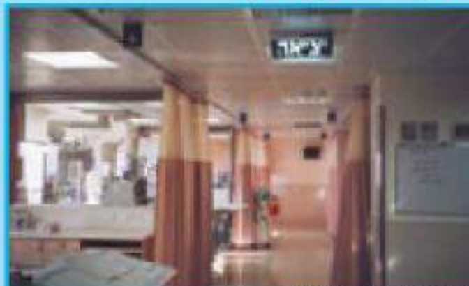
סימפל נטרף לטיפול המורחב