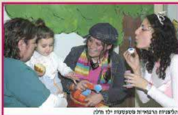
הלצניות הרפואיות מטפסות ילד חולה