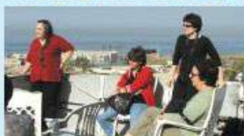
הפוסתופיסטיית בטיול סלל אביב