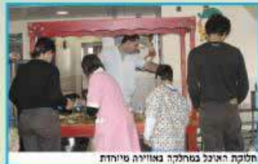
חלקת האוכל במחלקה באווירה מיוחדת

כדי להפחית לחצים, חששות ואי ודאות בקרב החורים ולהקל עליהם את הבנת מצבו של ילדם, נטבנו במחלקה דפי הסבר למרבית המחלות והבדיקות השכיחות המבוצעות במחלקה ובמרכז הרפואי. ניתן למצוא במחלקה דפי הסבר בתחומים כמו: אפילפסיה, פרכוסי חום, רפלקס בדרכי העיכול, בעיות נשימה וכו'. המידע מפתח תחושת אי ודאות וחוסר שליטה ומגביר את שיתוף הפעולה של הילד והוריו בטיפול.