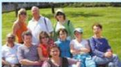
צוות אורולוגיה בטיול בשעה הרצון