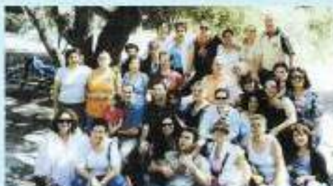
צוות מחלקת אי-אורן-נרן בטיול ביוניסלום