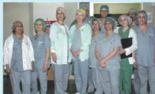
בית סינדי חדר ניתוח

לרגל יום אחות חדר ניתוח, שתוכנן בארגון האירופי EORNA שישראל תברה בו, פתח חדר הניתוח את דלתותיו לסיור בפני הצוות הסיעודי של מרכז רפואי "כרמל".