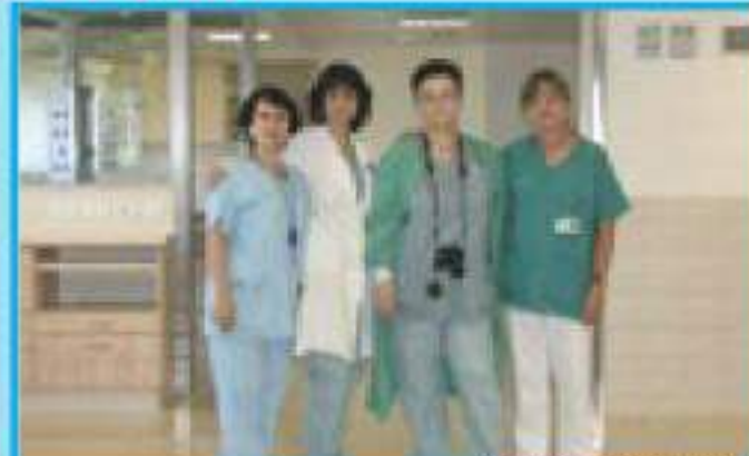
אחיות סימפל נטרף לטיפול